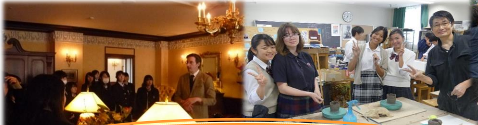
濃密な50分 深層に迫る探究学習