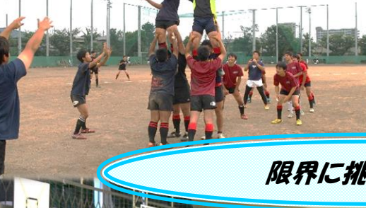
限界に挑む部活動