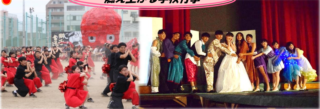
燃え上がる学校行事

「チーム石神井」で文武二道の両立を！ Pursue your academic study & Enrich your positive humanity!