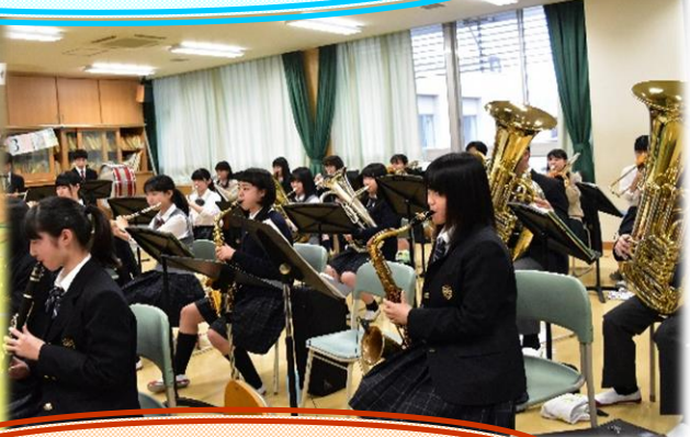
伸び続ける進学実績

「チーム石神井」で文武二道の両立を！ Pursue your academic study & Enrich your positive humanity!